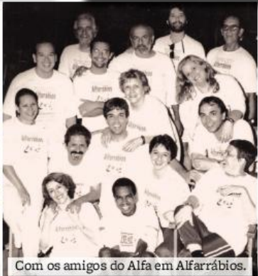
Com os amigos do Alfa em Alfarrábios.