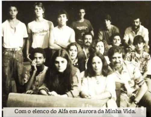
Com o elenco do Alfa em Aurora da Minha Vida.