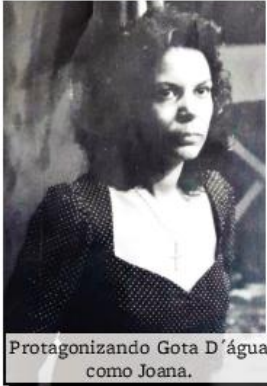
Protagonizando Gota D'água como Joana.